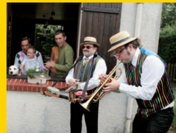
Les fanfares sont allées visiter les quartiers