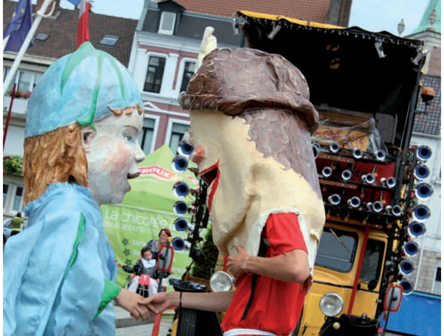
Chicou et les Grosses Têtes, symboles des Chicoriades.