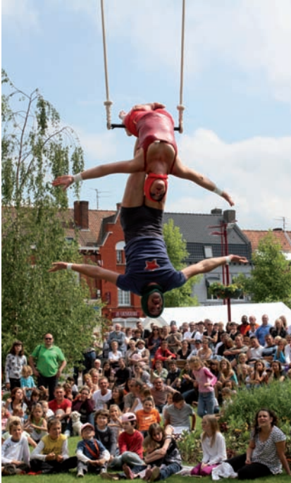
Les Cagoulés, spectacle de trapèze décalé.