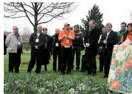
Une nouvelle variété de fleurs a été créée : la tulipe d'Orchies