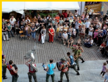
Une foule de 5000 personnes s'est régalée tout au long du week-end