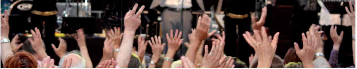
800 paires de mains se sont levées pour le Ruki Zuki de Kubiak