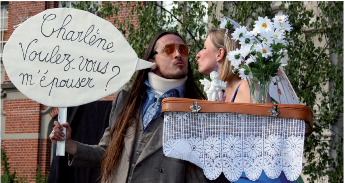
Les Métales Gnoux : du délire !