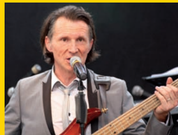
Kubiak : un énorme succès