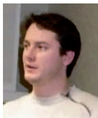
«Il y a des jeunes agriculteurs, pour faire vivre l'agriculture !»