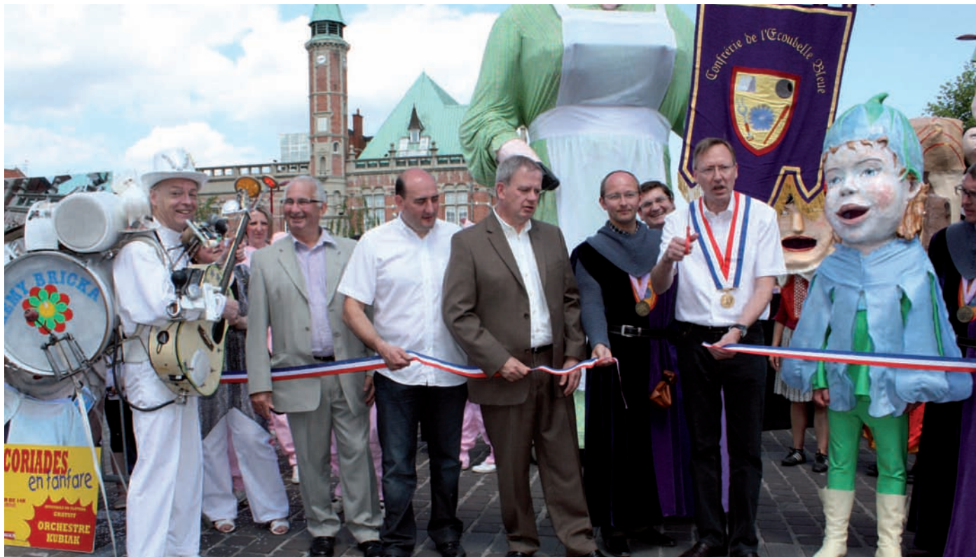
L'inauguration des Chicoriades par M. le Maire, accompagné des élus et de représentants de l'Écouvelle Bleue a succédé au baptême de Chicou

Immense est un mot faible pour qualifier le succès rencontré par les Chicoriades 2009. La fanfare a envahi les rues d'Orchies et rassemblé pas moins de 5000 spectateurs. Une petite frayeur au niveau météo le dimanche matin puisque la pluie a empêché le concert de l'harmonie, mais le pique nique a eu lieu, accueilli dans le hall de la mairie. Rien n'empêche de faire la fête à Orchies, et même le soleil est revenu sauvant les Chicoriades de la noyade.