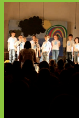
Ecole Primaire Jules Ferry