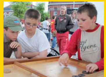
Les jeux d'antan ont encore une fois fait la joie des petits et des grands.