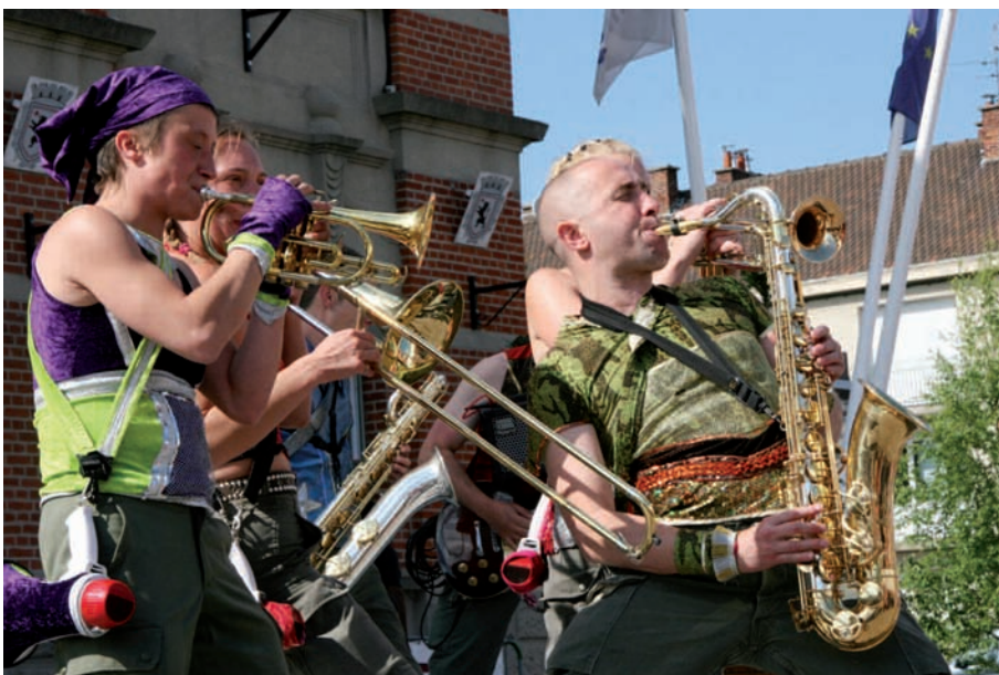
Les Dissidents Chaber ont revisité de manière particulière les tubes des années 80.

En attendant avec impatience l'année prochaine, sachez que déjà les idées fusent et que la municipalité souhaite faire encore mieux, c'est dire !