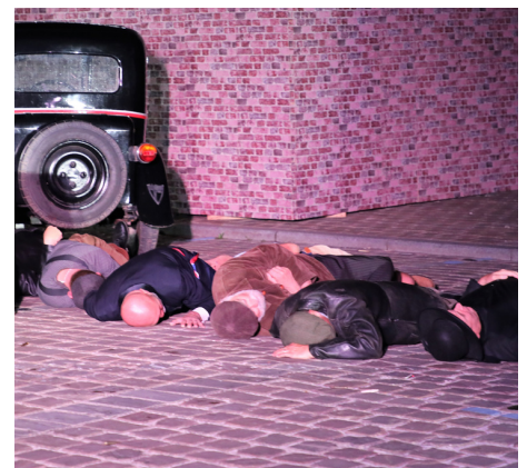
Des images fortes tout le long du week-end : les soldats alliés à l'EHPAD, le char Sherman sur la Grand-Place, et le (vrai) maire, ainsi que le (vrai) curé fusillés par les nazis.