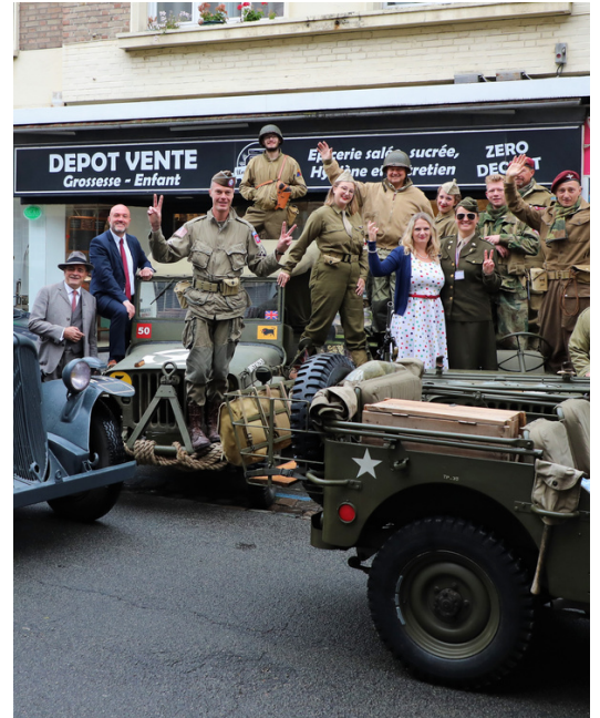
Les commerçants, en tenue d'époque, se sont pris au jeu en décorant leurs vitrines

Le grand spectacle du samedi soir a rassemblé près de 3 000 personnes, venues vivre en immersion les grandes étapes de la guerre, de la mobilisation à la libération. Et enfin le défilé du dimanche matin restera lui aussi dans les mémoires, accueillant un char Sherman sur le parvis de l'Hôtel de Ville.