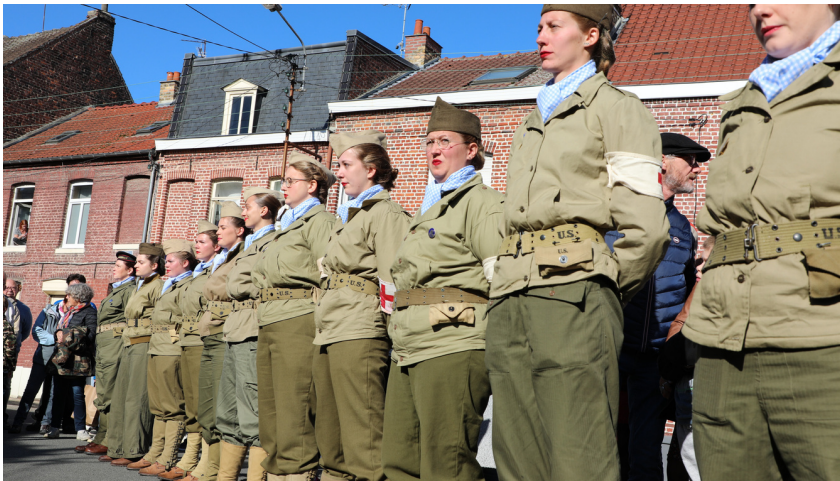
Le grand défilé était composé de troupes militaires mais également de la population en liesse