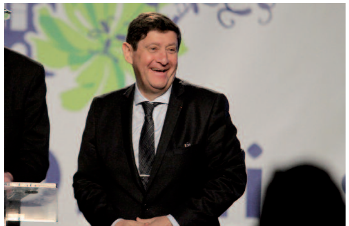
Patrick Kanner, Ministre des Sports était présent pour la Cérémonie